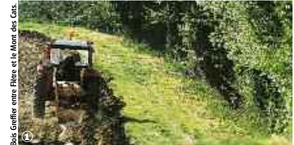
Bois Greffier entre Flêtre et le Mont des Cats.

Randonnée Pédestre Sentier du Bois greffier : 12 km