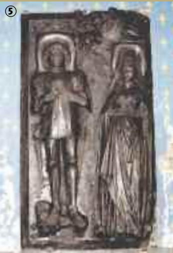
Pierre tombale d'Antoine Van Houtte, église de Flêtre.

particulièrement de la vente des Biens Nationaux. Il a subi également les destructions liées aux guerres et doit encore aujourd'hui se méfier des pillages. Il est vrai que certaines pièces sont des joyaux, qui témoignent de la richesse de l'Eglise sous l'Ancien Régime. L'église Saint-Mathieu à Flêtre en est la plus parfaite illustration. De l'extérieur, on remarque l'Hallekerque, cette église à trois nefs typiquement flamande ; mais l'essentiel se passe à l'intérieur. L'édifice religieux abrite un majestueux repositoire du XVIIIème siècle, encore appelé