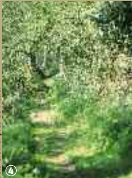
Bois Greffier près de Flêtre.

Le patrimoine ecclésiastique flamand est l'un des plus remarquables du département. Comme partout ailleurs en France, il a souffert des troubles de la Révolution et