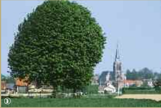
Village de Flêtre.

Le patrimoine ecclésiastique flamand est l'un des plus remarquables du département. Comme partout ailleurs en France, il a souffert des troubles de la Révolution et