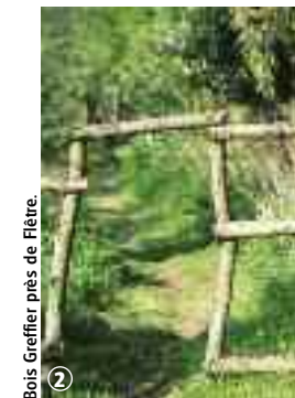
Bois Greffier près de Flêtre.