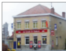
Les sentiers du Mt Kokereel et de l'Ondank Meulen »