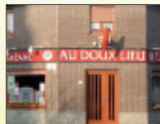
Circuit de la gloriette

Spelletjes, tabakswinkel, binneplaats, frituur