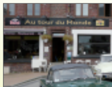
Circuit du Pantgat GR de l'Yser

Thema avonden, grote parking, tweetalig : frans/ingelsch