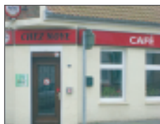
Circuit « La Tour blanche » à proximité

Klein restauratie mogelijk op reservatie. Terras