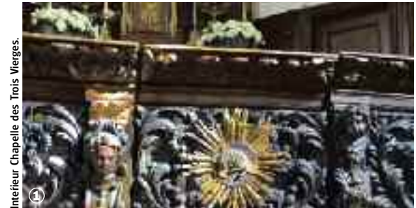
Intérieur Chapelle des Trois Vierges.

Randonnée Pédestre Du Gibet au Paradis : 11,5 km ⌚ Durée : 3 h 00 à 3 h 50 ➔ Départ : Caëstre : église, parking 🟡 Balises jaunes 📄 Cartes IGN : 2403 Ouest et 2404 Ouest