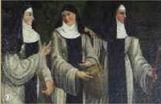
Tableau légende des Trois Vierges.

Faisant halte à Caëstre, un ancien camp militaire romain, les trois sœurs Edith, Elfride et Sabrina se seraient crues en totale sécurité. Tel ne fut pas le cas ! Voici la légende des Trois Vierges de Caëstre. La scène se déroule en 855. Trois jeunes sœurs d'origine anglaise, refusent la main de prétendants pour consacrer leur vie à Dieu. Elles décident d'entreprendre un pèlerinage vers Rome. En route, elles font escale à Caëstre. C'est là qu'elles sont sauvagement assassinées par trois brigands, peut-être les chevaliers éconduits. Un seigneur aveugle résidant non loin du drame, aurait eu alors l'apparition de la Vierge Marie lui demandant de se rendre sur les lieux du crime, en s'aidant du cri des oiseaux. Sur place, il se serait humecté les paupières du sang des victimes et aurait retrouvé la vue. Il aurait, en l'honneur de la Vierge Marie et des trois martyres, fait édifier la chapelle. Légende ou pas, les fondations