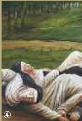
Tableau légende des Trois Vierges.

architecturales prouvent que la chapelle existe au moins depuis le XI e siècle ; celle-ci devint un haut