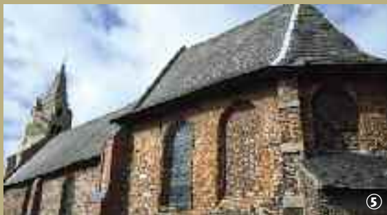
Chapelle des Trois Vierges.

lieu de pèlerinage sous l'Ancien Régime, tandis qu'un nouveau clocher l'abrite depuis 1887. Retrouvez le récit de cette légende à l'intérieur même de l'église, à travers un vitrail et un tableau du XIX e siècle, copie d'une œuvre probablement disparue à la Révolution.