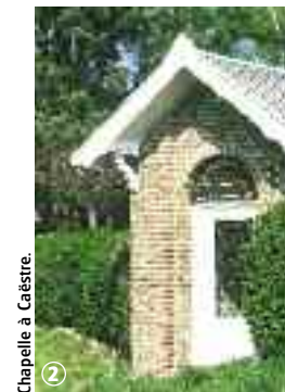
Chapelle à Caëstre.