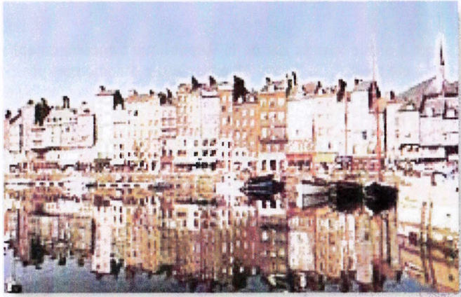
le Vieux Bassin