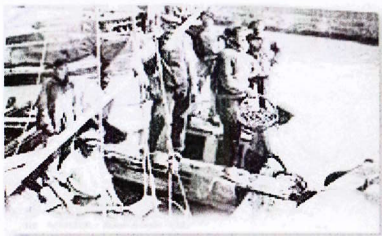
pêcheurs de moules