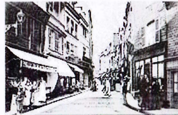
Rue du Dauphin

En cas de problèmes : appeler Léonce ou Jean Paul Tél: 06 67 33 40 39 - 06 85 90 97 47